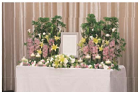
こちらは、50万円コースでご提供させていただいた花飾りです。

くらしの友では、大切な儀式にふさわしいクオリティでお応えできるよう、自社内に生花部を設けております。花飾りは、故人の思い出に合わせて、花の種類・色合い・形等をご希望に合わせてデザインいたします。