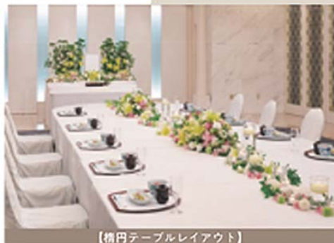
【楕円テーブルレイアウト】