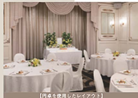
【円卓を使用したレイアウト】